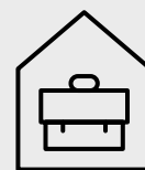
Radnici koji rade od kuće