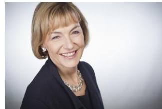
Prof. dr. sc. Vesna Pusić

Prva potpredsjednica Vlade RH i ministrica vanjskih i europskih poslova